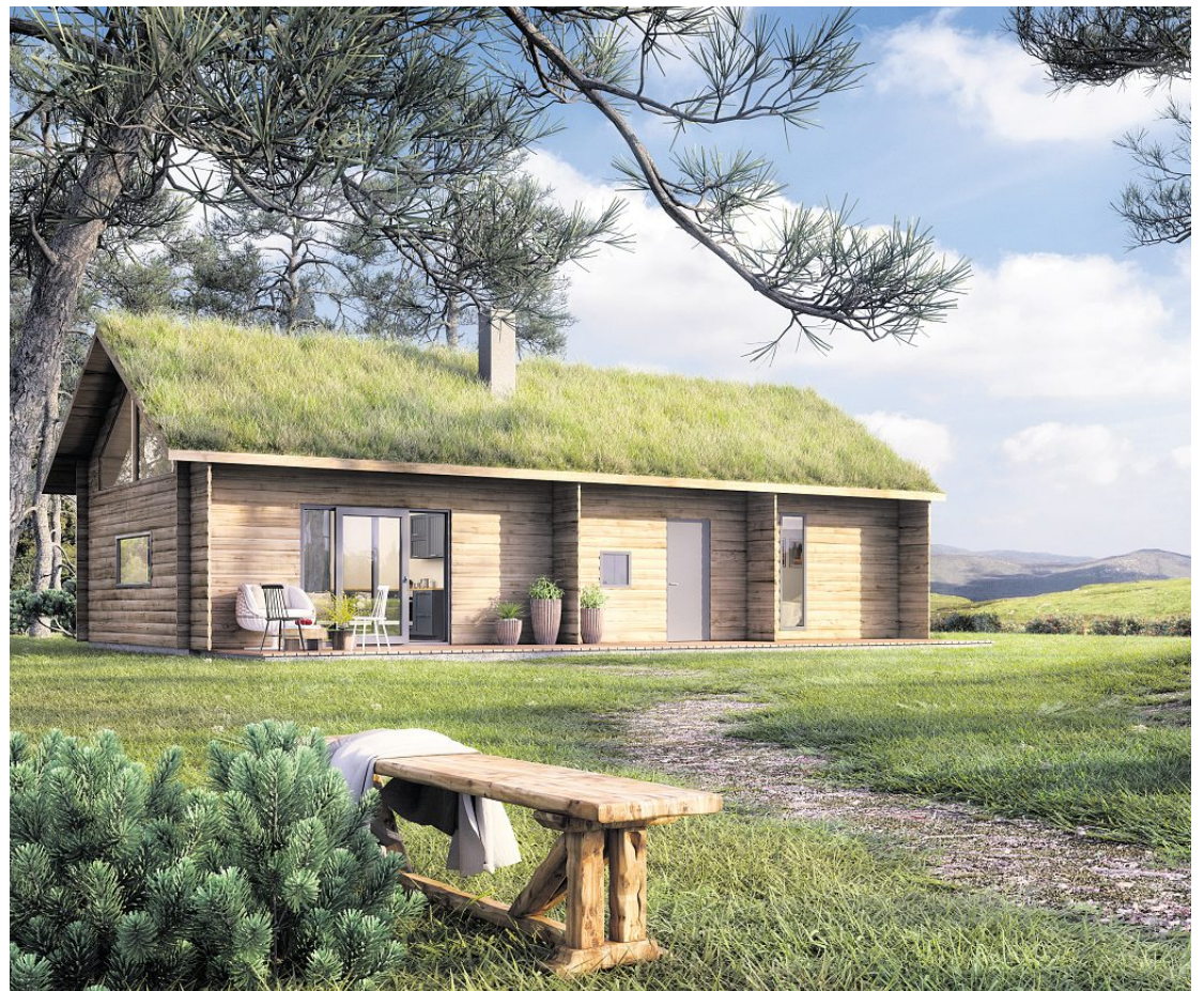
Laftehytta er et eksempel på de nye hyttetyperne selskapet nå tilbyr.