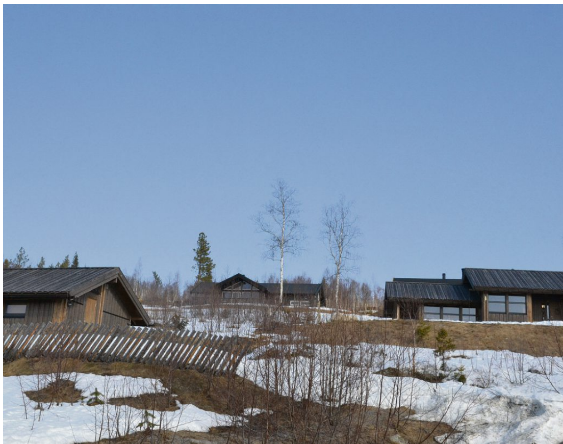
Mjuken hyttegrend ligger solvendt til bare noen hundre meter fra Berkåk sentrum.